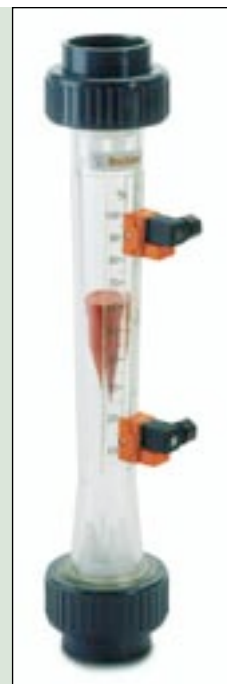
Modell eines Durchflussmessers mit Grenzwertkontakten

Bei diesem Schwebekörper-Durchflussmesser sitzt der feinfühligste Schwebekörper reibungsfrei im Messrohr